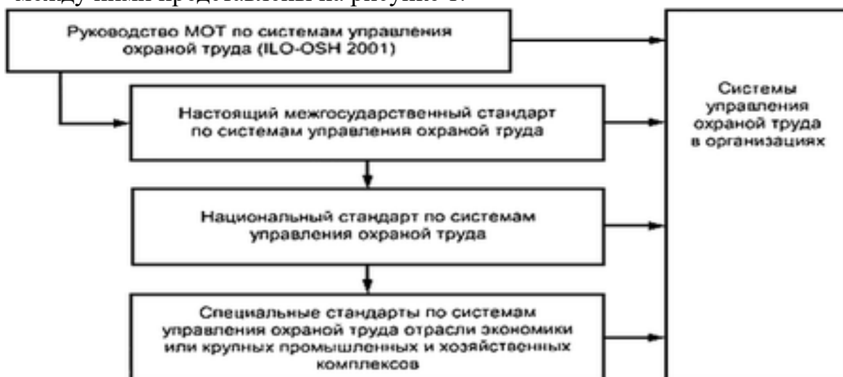
Рисунок 1 - Элементы национальных структур систем управления охраной труда

3.3.2 Элементы национальных структур управления охраной труда и связи между ними представлены на рисунке 1.